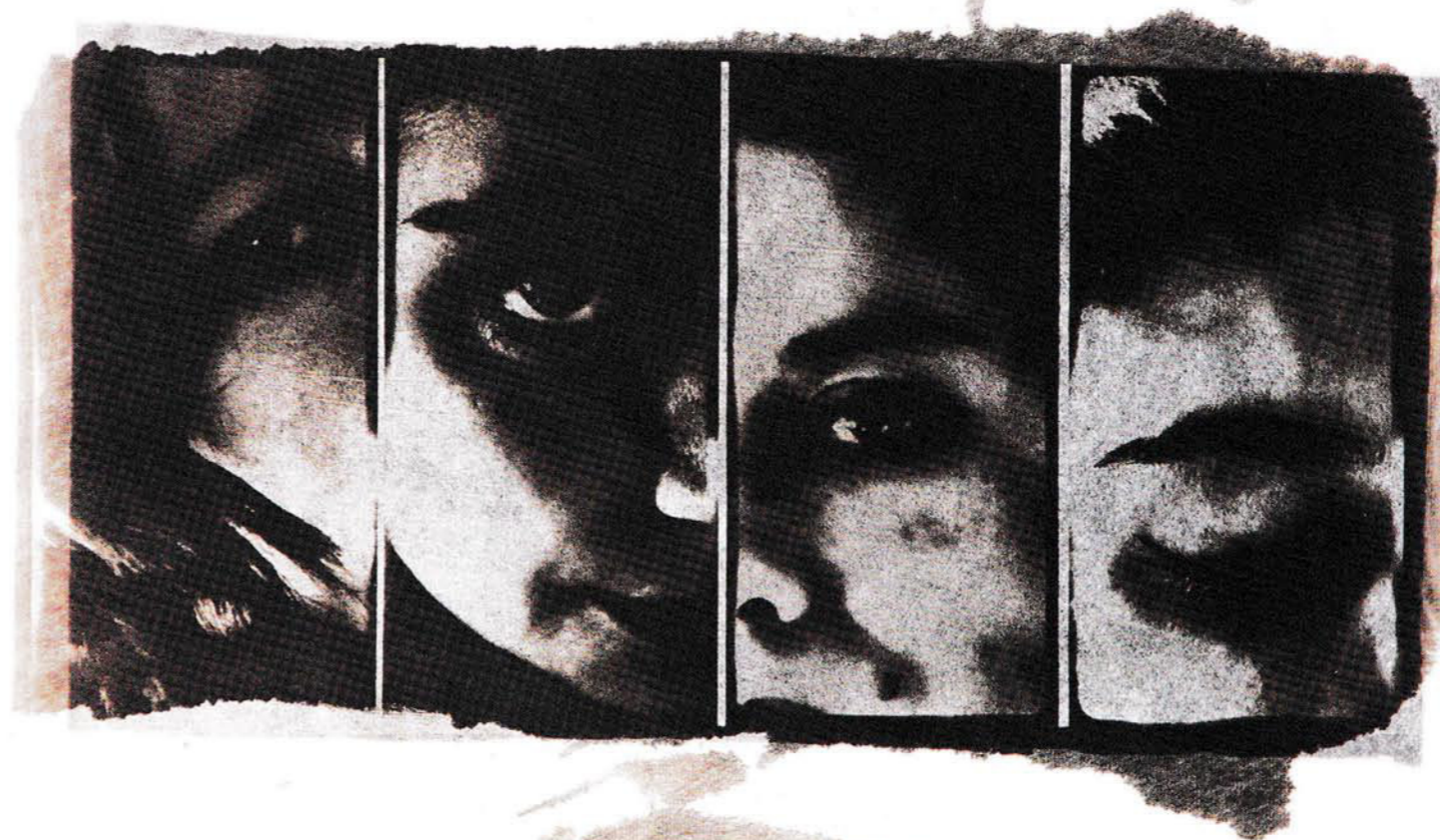
Frank Gerald Hegewald Portraits 2014, Cyanotypie auf Japanpapier, 60 × 30 cm